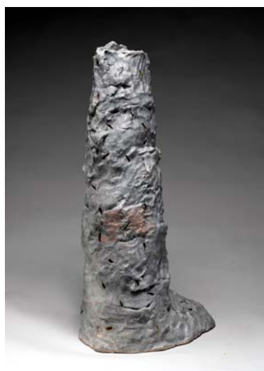
Haut : Syuntei Kato