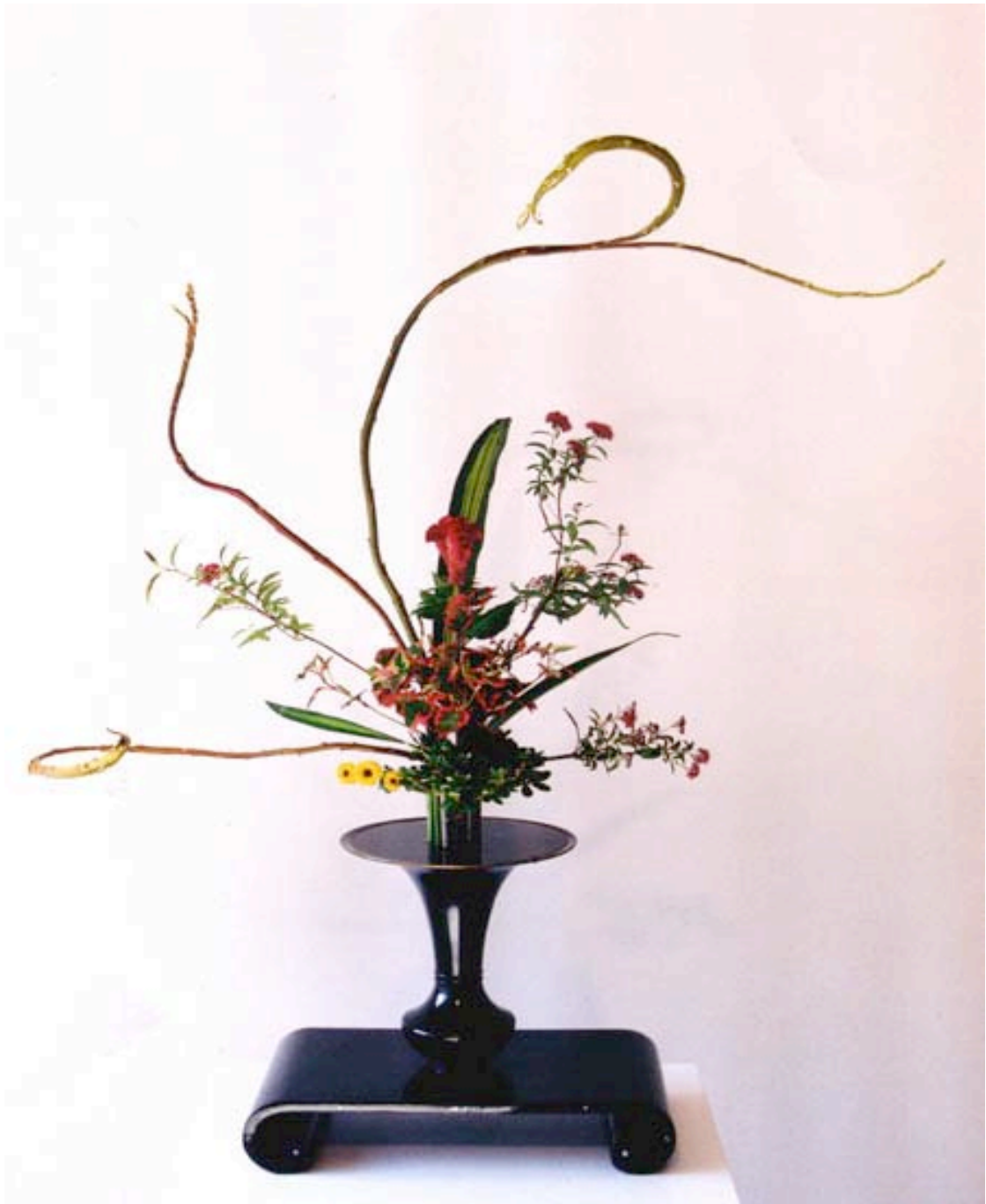
Ikebana par Murette Renaudin