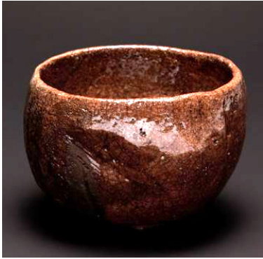
Andoche Praudel France