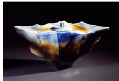
Toshio Ohi Japan