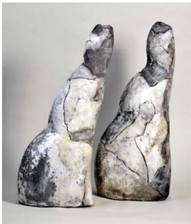
Gisèle Buthod-Garçon France